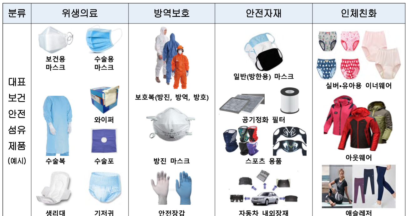
< 보건·안전 섬유제품 예시 >